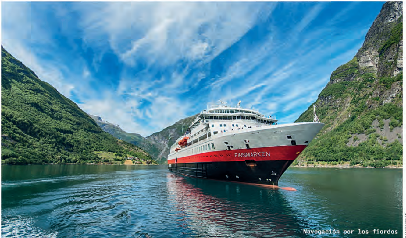
Navegación por los fiordos